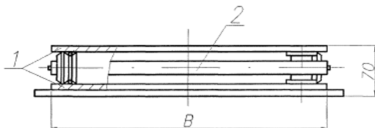
1 - плита опорная; 2 - обойма катковая